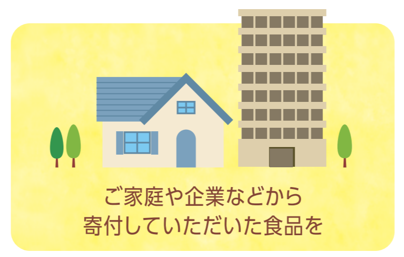
ご家庭や企業などから 寄付していただいた食品を